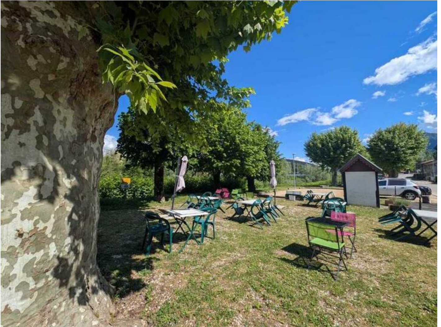
La Cantine du Pont 38470 Saint-Gervais Une halte idéale pour les cyclistes, à proximité immédiate de la Véloroute la Belle Via.