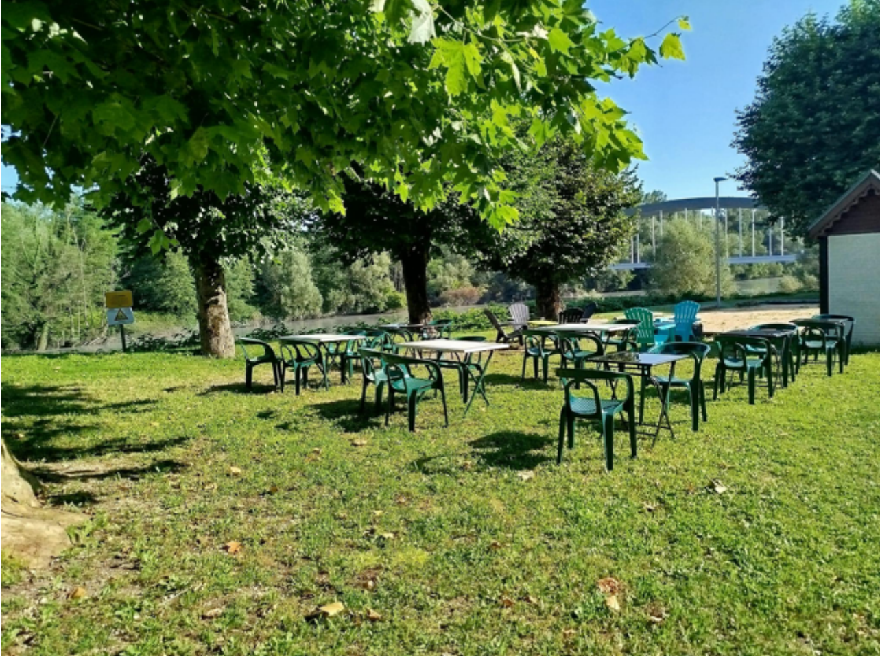
La Cantine du Pont 38470 Saint-Gervais Une halte idéale pour les cyclistes, à proximité immédiate de la Véloroute la Belle Via.