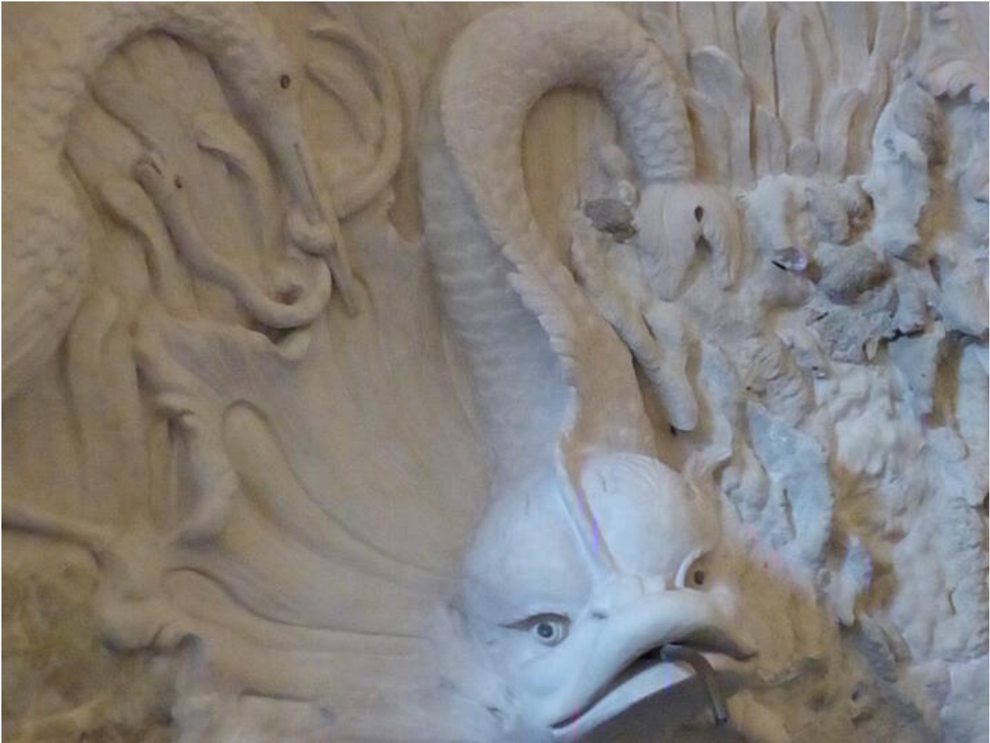
Visite guidée Saint-Antoine au fil du temps - Le temps du renouveau : art et collections 38160 Saint-Antoine-l'Abbaye

Visite permettant de découvrir des espaces qui ne sont pas ouverts au public.